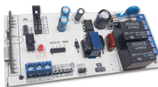
Central de Comando para Automatizadores de Portão